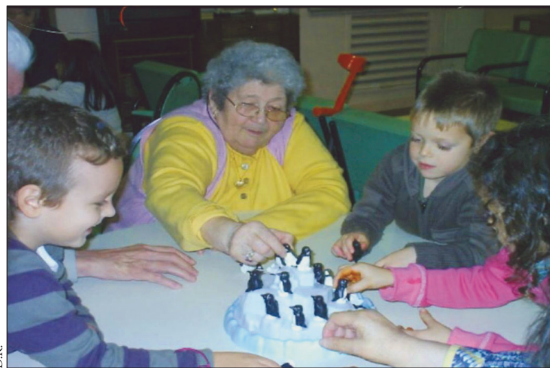
Au programme de ces rencontres intergénérationnelles, des séances de jeux autour desquelles se noue une tendre complicité.

C'est dans cet esprit que, de temps en temps, les seniors se déplacent jusqu'à l'école, invités par les enfants qui les reçoivent avec force gâteaux. Appelés Temps forts, ces rendez-vous sont mis sur pied à l'occasion d'évé-