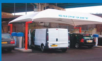
Sécurisation par surveillance vidéo