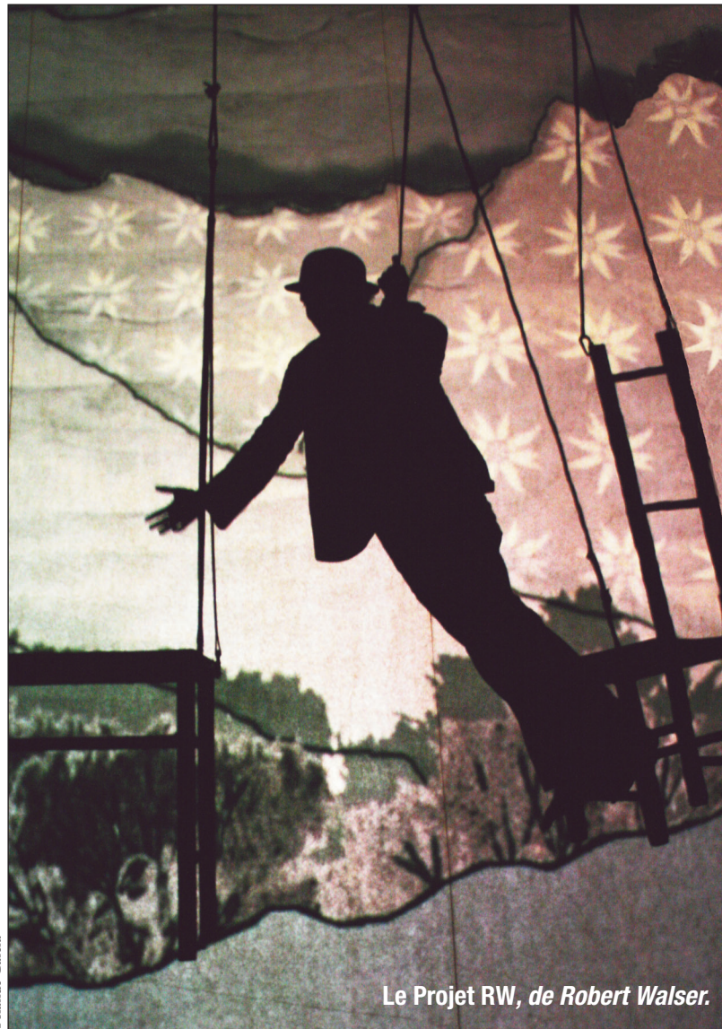
Le Projet RW, de Robert Walser.