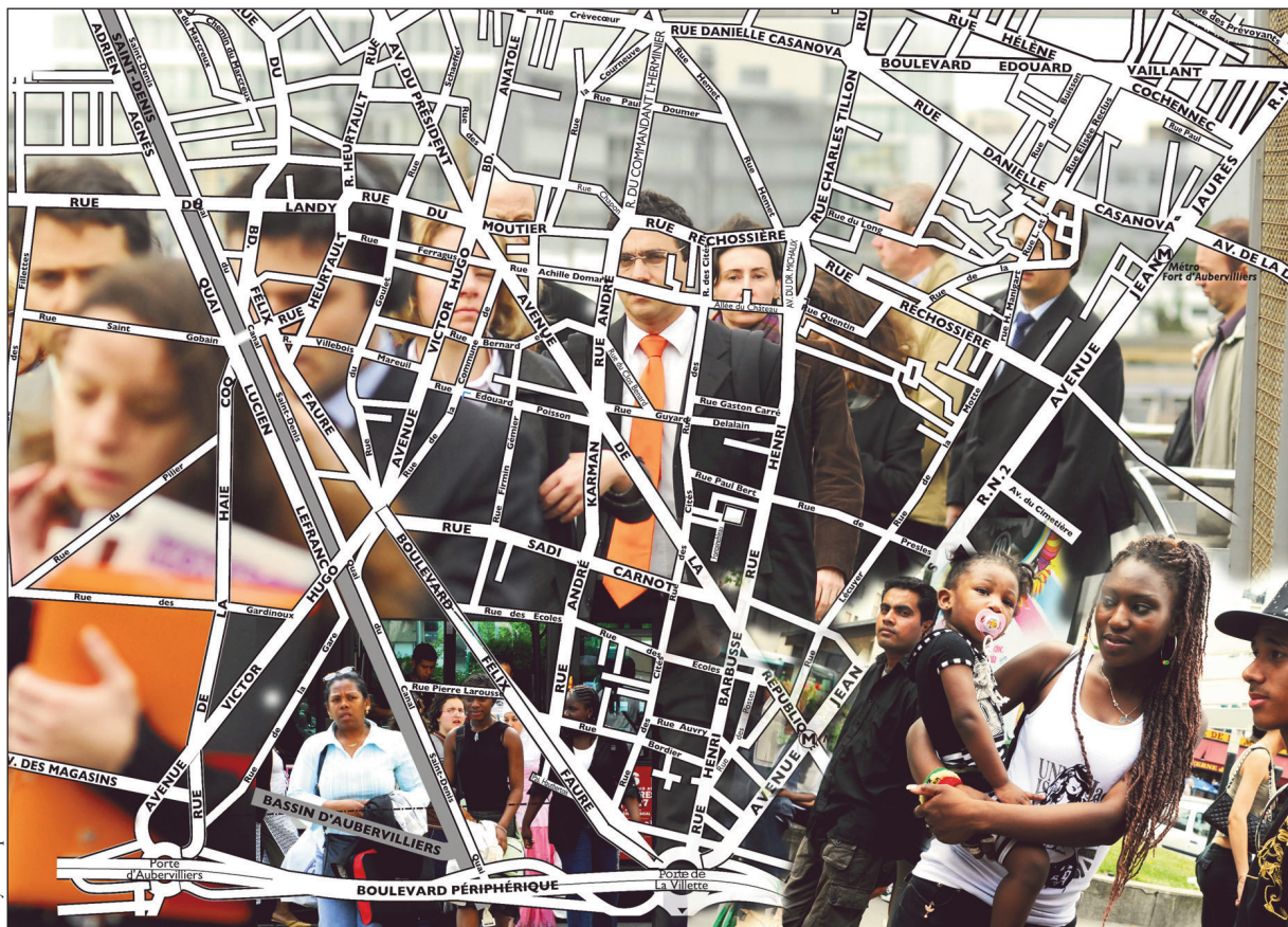
Chiffres à l'appui, Aubervilliers change : la ville s'enrichit chaque année d'un millier d'habitants. Un mouvement qui tend à s'amplifier avec l'édification de nouveaux quartiers tels que la Porte d'Aubervilliers.

De fait, et depuis 1999, on a assisté à la destruction de plus de 1 600 logements impropres à l'habitat cepen-