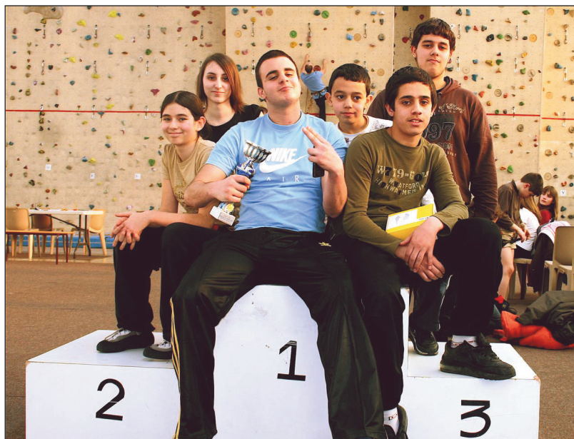
Les jeunes grimpeurs du CMA ont pris de la hauteur.

Des sorties ponctuent la vie du club, tantôt chez les voisins de l'association MurMur de Pantin, tantôt à Villiers-le-Bel dans le cadre d'un