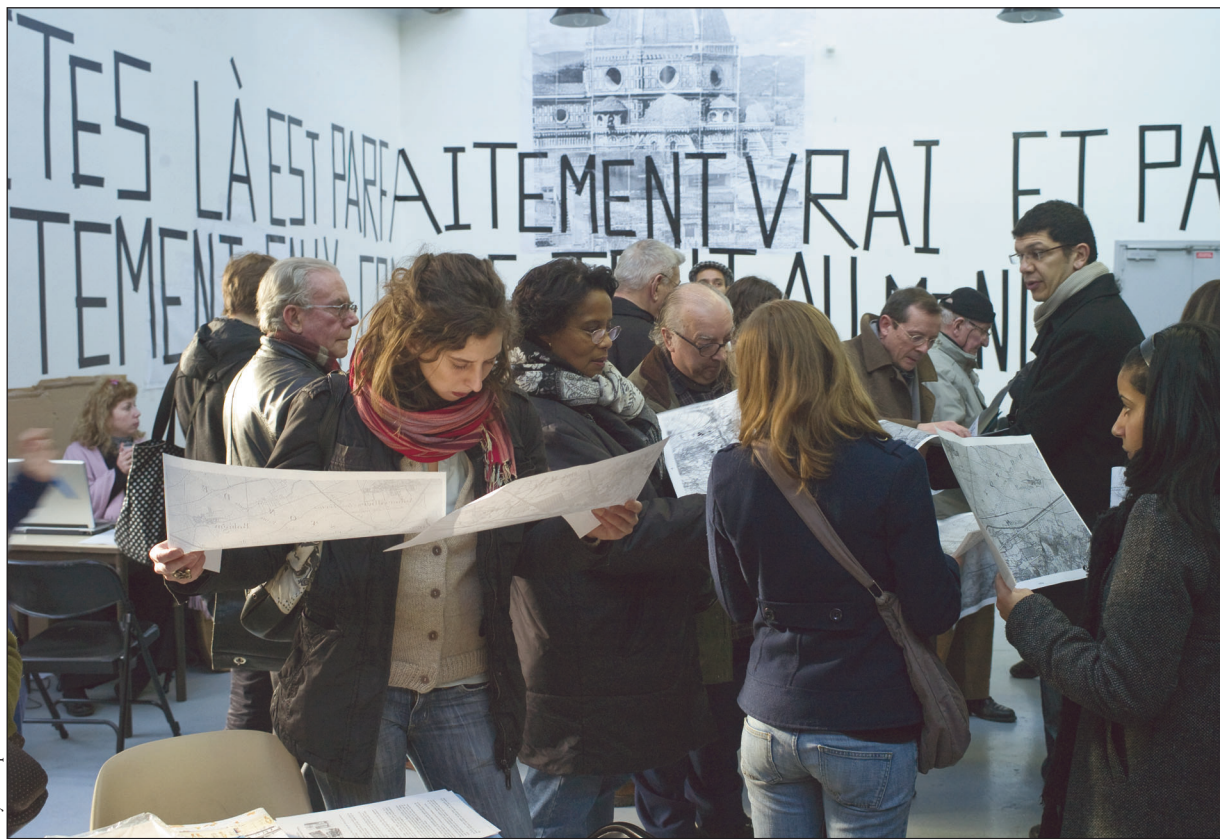
Les premières rencontres de la Petite Prusse... un état des lieux et un travail qui se poursuit.

Conférences, ateliers et balades urbaines aux Labos d'Auber... Deux pleines journées pour faire l'inventaire de l'Histoire et de la mémoire des Quatre-Chemins : une initiative d'Aubervilliers, Pantin et du service du Patrimoine culturel du Conseil général.