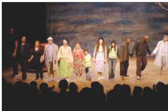
Une déambulation joyeuse dans un Paris farfelu parce que La forme d'une ville change plus vite hélas que le cœur des humains... soit la compagnie Les Madones, pour le meilleur et pour le rire à l'Espace Renaudie.