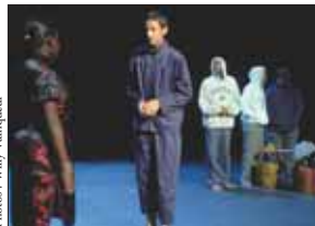
Les élèves de l'atelier artistique du collège Jean Moulin se sont mis sur le Brecht : La bonne âme du Setchouan dans la petite salle du TCA.

Les 22, 23 et 24 juin, le 6 de la rue des Noyers accueillait Porte-Voix, première initiative de l'association des Frères Poussière pour faire revivre à un vieux théâtre : un essai réussi et un public qui a répondu présent pour trois journées de slam, conte, théâtre, musique, photo et cinéma. E. G.