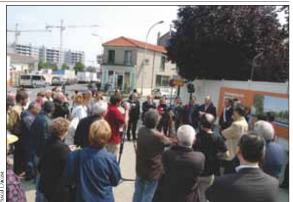
Populaire, la nouvelle place ? Bientôt... puisqu'elle sera au centre d'un nouveau quartier à cheval sur Aubervilliers et Saint-Denis.

Un mini quartier au milieu de nulle part ? Pas vraiment... Tout près, côté Saint-Denis, la ZAC Diderot aligne d'ores et déjà plusieurs centaines de logements neufs et d'autres sont à venir. Côté Aubervilliers, des grues pointent le bout de leurs flèches, avec un nouveau bâti-