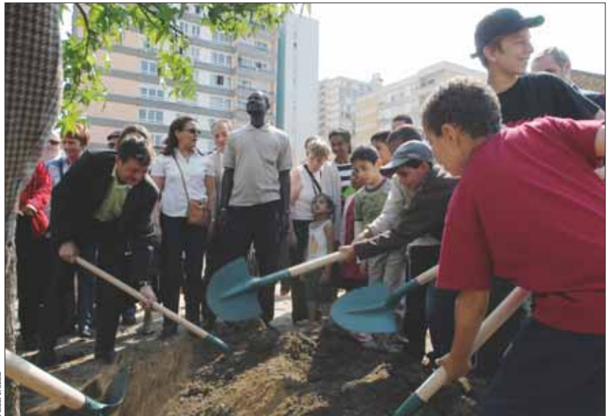
Le premier des 34 arbres (des liquidambers, des tulipiers, des érables planes et des magnolias) qui prendront leurs racines dans le nouvel espace vert.

Si l'endroit n'aura pas les dimensions d'un parc, cet espace vert de proximité sera tout de même bien doté. De quoi répondre, en partie, à un besoin exprimé de longue date par les habitants du quartier. De péripétie