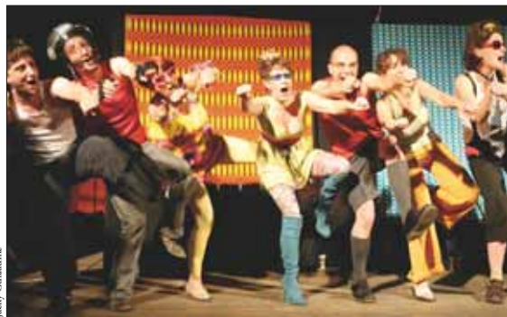
Festival Porte-Voix rue des Noyers... Du rock festif avec la rock'n'chorale parisienne L'Echo Râleur.