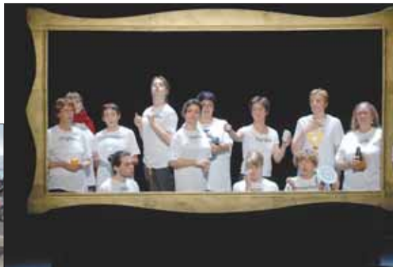
L'atelier théâtre du collectif ESORS (Et Si On Réchantait le Social) porte la voix de récits de femmes : Matergiversations au Théâtre de la Commune.