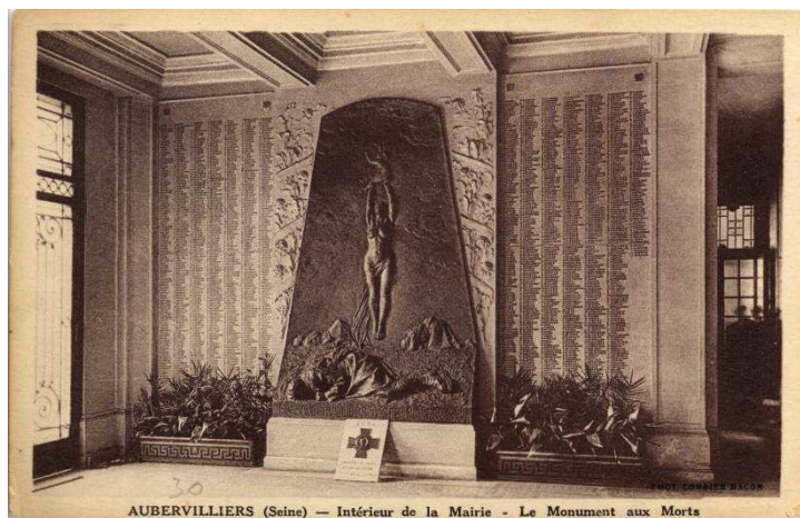
4Fi 707. Carte postale du monument aux morts d'Aubervilliers