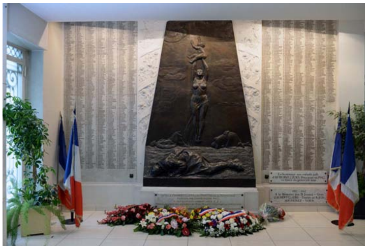
Photographie contemporaine du monument aux morts. Willy Vainqueur, 2014