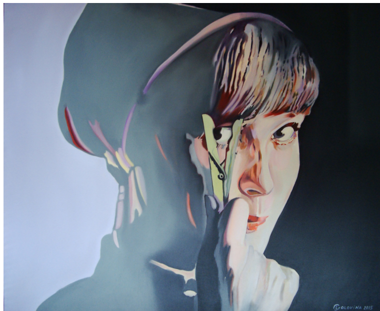
Tôt ou tard, 2015, Lena Golovina

Ce stage portera sur l'art du portrait associé à la technique singulière de la peinture à l'huile. Débutants comme confirmés, les stagiaires seront accompagnés dans l'apprentissage de cette technique sensuelle, dont les teintes variées sont révélées par la transparence.