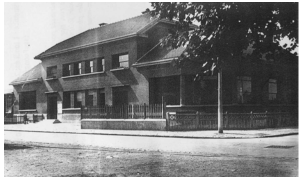
École du Montfort en 1953