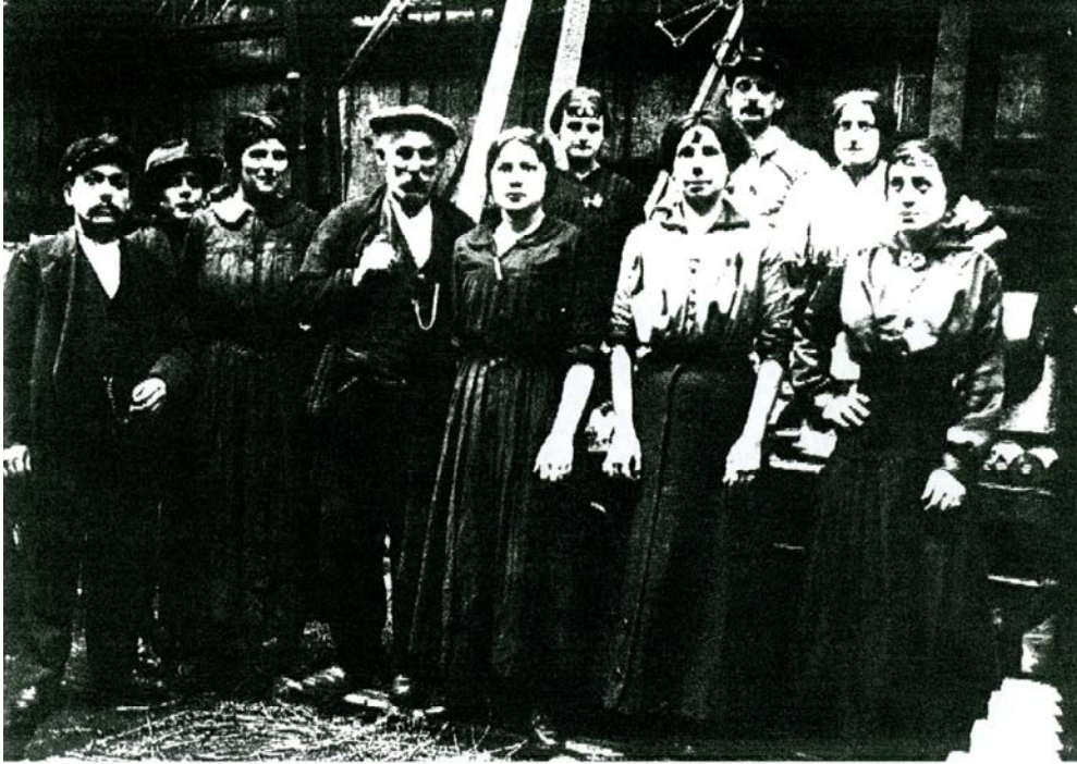
A l'intérieur de l'entreprise LABORDIERE en 1917