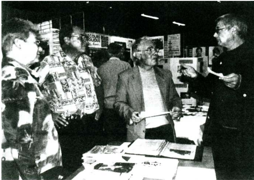
Le stand de la Société d'Histoire

Le 28/09/2002, notre société d'Histoire a tenu un stand à l'Espace Rencontre avec des panneaux et une table présentant nos ouvrages et documents. Cette journée nous a permis de rencontrer plusieurs associations intéressées à notre partenariat pour leurs activités.