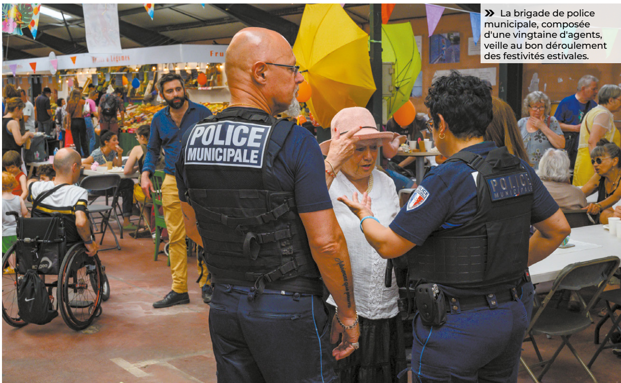
» La brigade de police municipale, composée d'une vingtaine d'agents, veille au bon déroulement des festivités estivales.