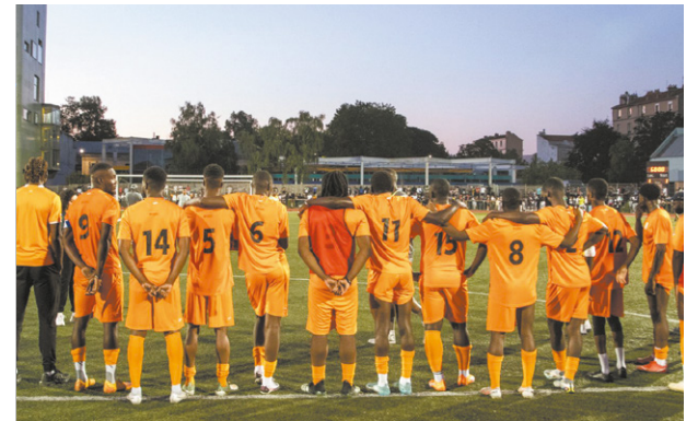
» 2 e édition d'Auber Nation Cup Le stade André-Karman était plein à craquer samedi 24 juin pour assister à la finale de la deuxième édition de la Coupe des nations de football organisée par la Mission locale, l'Omja et un collectif d'associations comme AuberMédiation ou À travers la ville. La Côte d'Ivoire a remporté le tournoi face à l'Algérie.