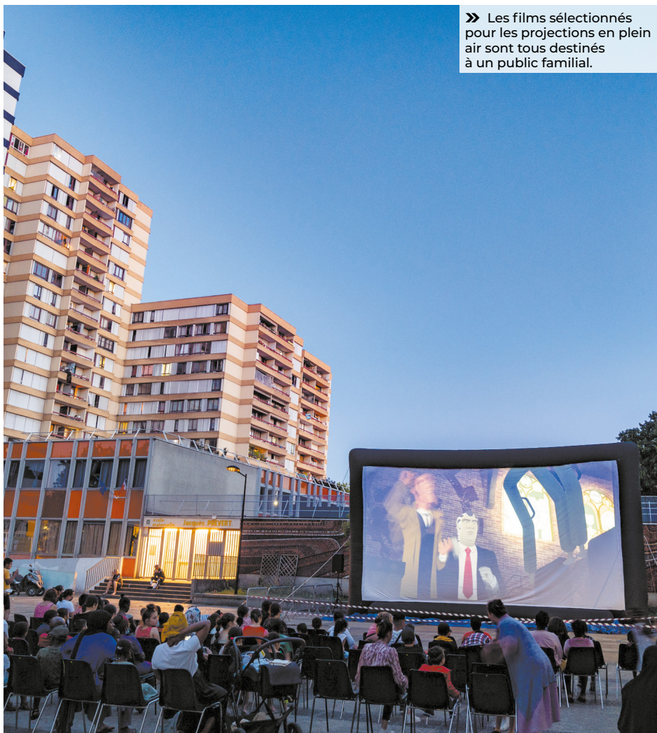
» Les films sélectionnés pour les projections en plein air sont tous destinés à un public familial.

aux Sports. D'autres activités spécifiques en dehors de la ville sont proposées à la journée uniquement, moyennant parfois une participation financière de quelques euros : baignade, rafting, surf, stand up paddle, kayak, piscine à vagues, équitation, vélo, Koezio (parc d'aventures avec jeux géants, labyrinthe, accrobranche indoor, escape game), sortie à la mer, etc. Retrouvez le programme complet, jour par jour, sur le site internet de la Ville.