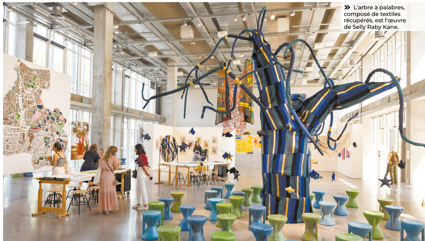
» L'arbre à palabres, composé de textiles récupérés, est l'œuvre de Selly Raby Kane.

Pour retrouver toute la programmation : https://www.le19m.com/sur-le-fil-dakar-paris