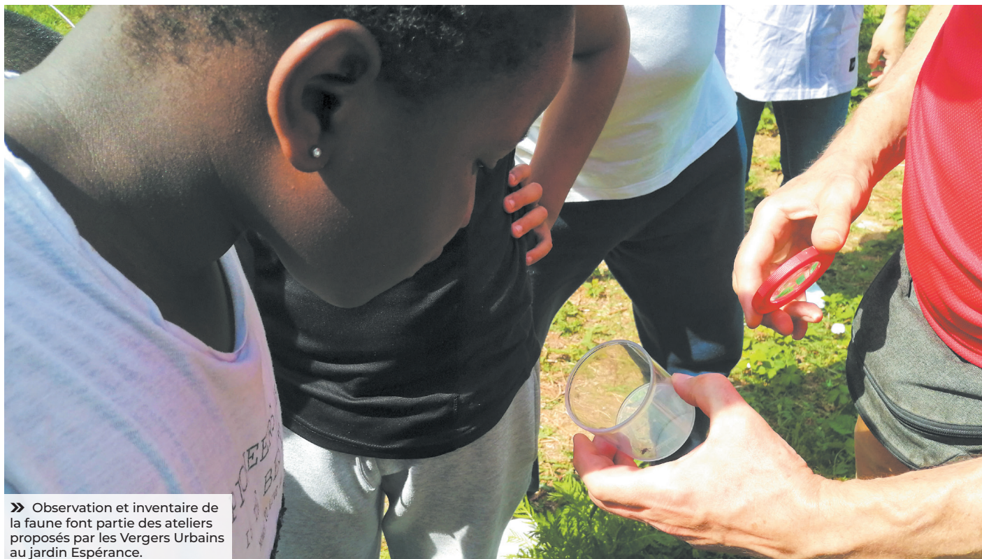
» Observation et inventaire de la faune font partie des ateliers proposés par les Vergers Urbains au jardin Espérance.