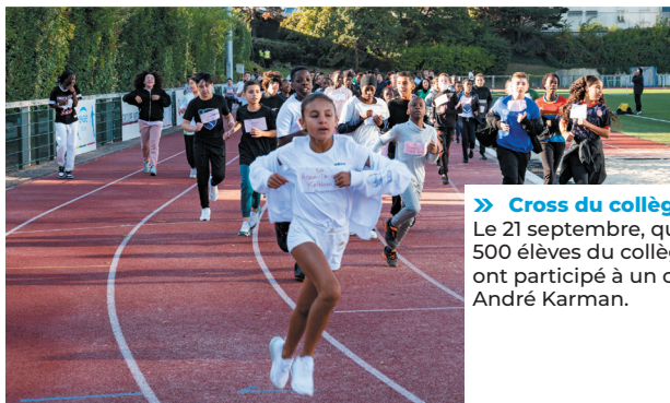
» Cross du collège Diderot Le 21 septembre, quelque 500 élèves du collège Diderot ont participé à un cross au stade André Karman.

» Le Maire et les élus à votre écoute Le Maire, Karine Franclet, et les élus ont échangé avec les habitants sur les sujets de la vie municipale, lors du premier rendez-vous « Le Maire et les élus à votre écoute », samedi 24 septembre, place du métro Mairie d'Aubervilliers. Prochaine rencontre samedi 19 novembre au marché du centre.