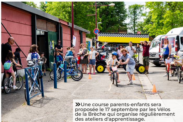
» Une course parents-enfants sera proposée le 17 septembre par les Vélos de la Brèche qui organise régulièrement des ateliers d'apprentissage.