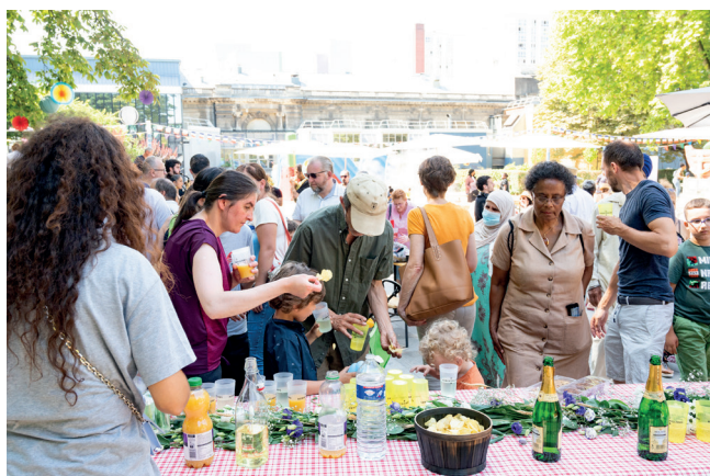
>> Animation quartier Vallès