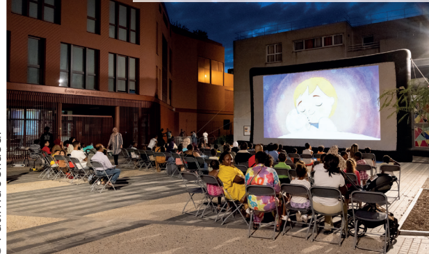
>> Cinéma de plein air quartier du Landy