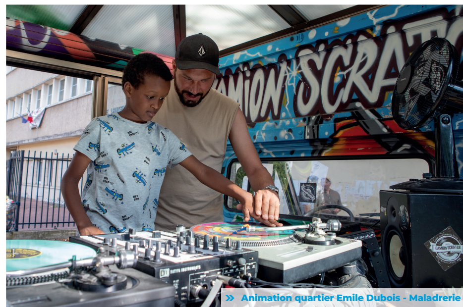
>> Animation quartier Emile Dubois - Maladrerie

>> Le Maire, Karine Franclet, a inauguré le lancement des festivités de l'Été à Aubervilliers, le 9 juillet dernier au square Stalingrad. Jusqu'au 28 août, de nombreuses activités à destination des enfants tout comme des espaces détente à l'ombre des arbres pour toute la famille ont été proposés. Dans le cadre des célébrations du 14-Juillet, un feu d'artifice a été tiré au parc Eli Lotar le 13 juillet suivi d'un apéritif républicain le 14 juillet au square Stalingrad. Des animations se sont également tenues dans les quartiers de la ville.