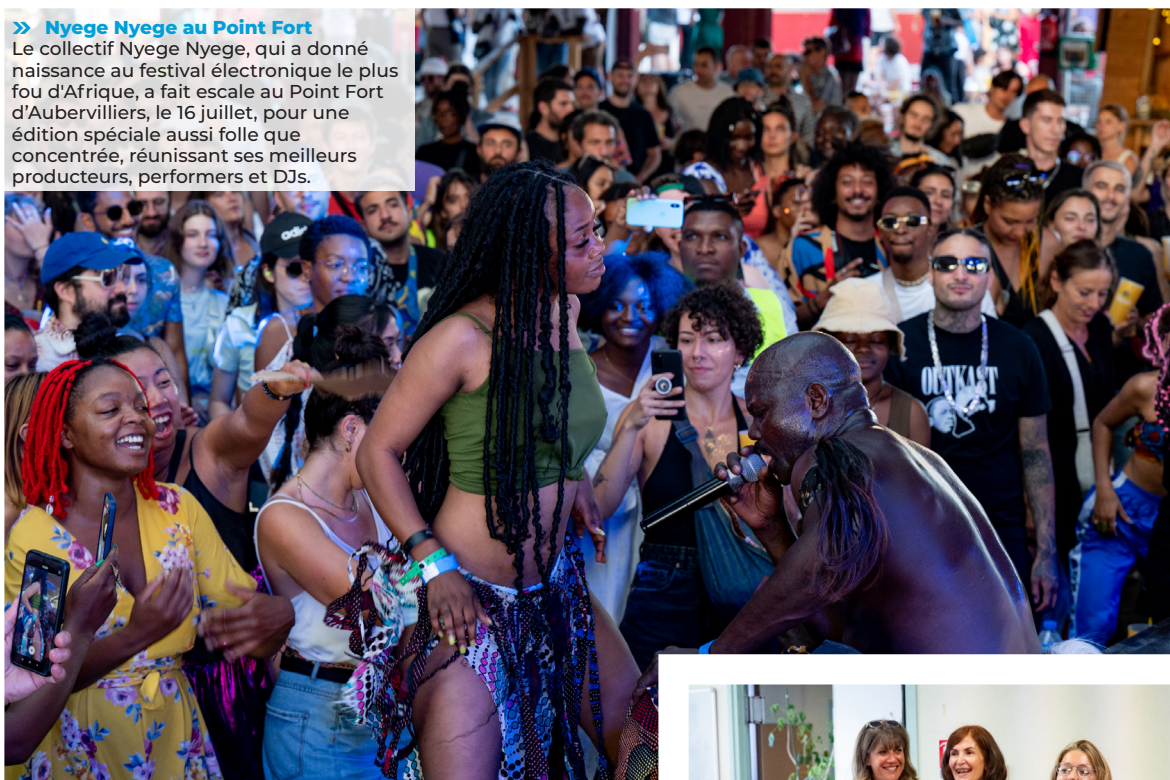
» Nyege Nyege au Point Fort Le collectif Nyege Nyege, qui a donné naissance au festival électronique le plus fou d'Afrique, a fait escale au Point Fort d'Aubervilliers, le 16 juillet, pour une édition spéciale aussi folle que concentrée, réunissant ses meilleurs producteurs, performers et DJs.