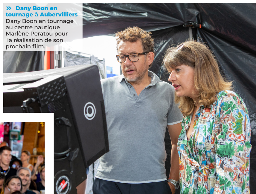
» Dany Boon en tournage à Aubervilliers Dany Boon en tournage au centre nautique Marlène Peratou pour la réalisation de son prochain film.