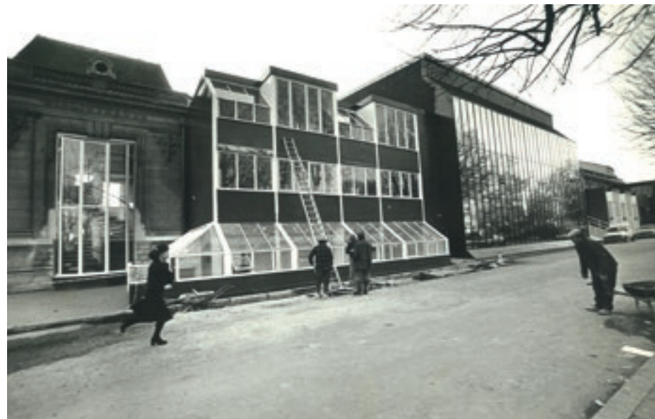
Le Théâtre de la Commune au moment de son inauguration, en 1965.