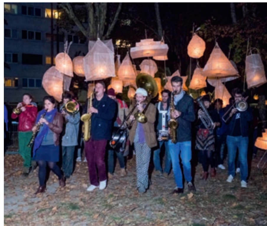
Déambulation des Lanternes, Lumières sur la ville, 2018.

Appel à bénévoles : rejoignez l'équipe des Poussières. Contactez le 01.43.52.10.98 elisabeth@lespoussieres.com