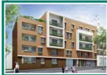
VUE SUR LE QUAI ADRIEN AGNES

L'agrément du lieu est encore accentué par la présence de beaux espaces verts paysagés qui participent à l'harmonie de votre nouveau cadre de vie.