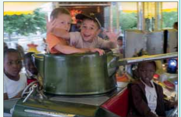
Le manège enchanté a tourné à plein régime pour les petits.