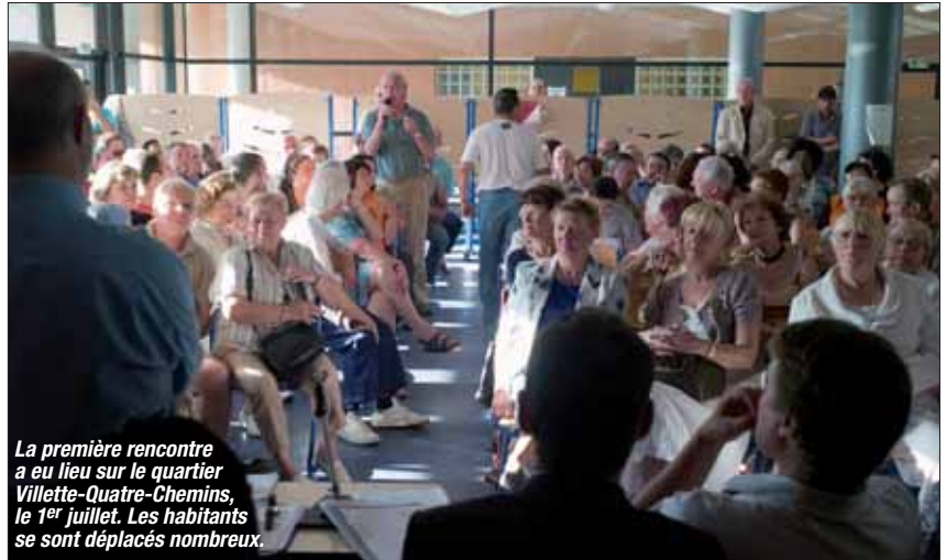
La première rencontre a eu lieu sur le quartier Villette-Quatre-Chemins, le 1 er juillet. Les habitants se sont déplacés nombreux.

Nous sommes déjà en train de réorganiser la police municipale qui