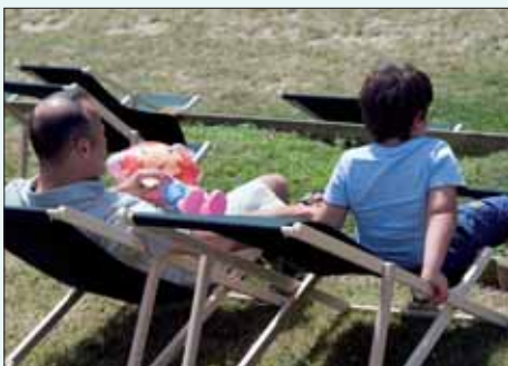
Pas d'âge pour se prélasser dans les transats mis gracieusement à disposition par la Ville.