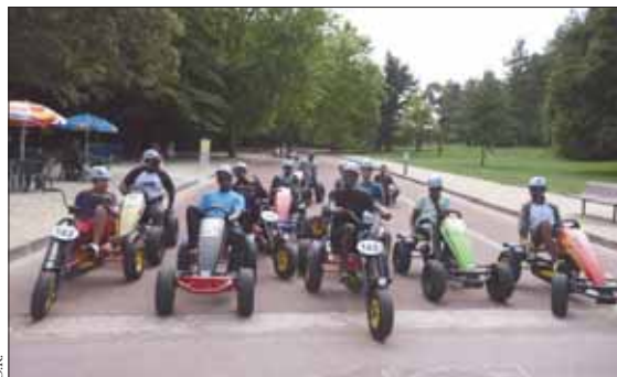
Dans le cadre des opérations Ville-Vie-Vacances, une centaine de jeunes de l'Omja ont participé à différentes activités sportives, comme le Big Shuttle, au parc départemental de La Courneuve.