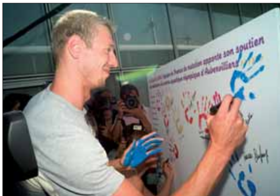
Comme ses compagnons de l'équipe de France, le médaillé d'or, Alain Bernard, avait revêtu le tee-shirt de la ville avant de signer son engagement en faveur du futur centre aquatique d'Aubervilliers.

Pour mémoire, cet équipement devrait s'étendre sur près de 21 000 m 2 , comprenant cinq bassins dont quatre couverts. En septembre, le jury déterminera le projet architectural choisi