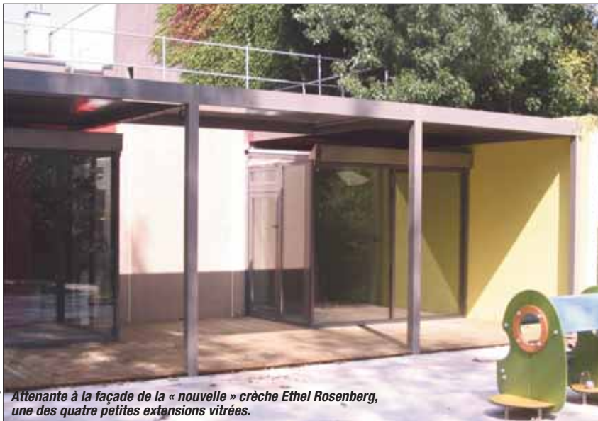
Attenante à la façade de la « nouvelle » crèche Ethel Rosenberg, une des quatre petites extensions vitrées.

Après un an de travaux, c'est à un équipement totalement restructuré et rénové qu'accéderont parents, enfants et personnels. D'une crèche à la conception datée, l'on sera passé à un bâtiment fonctionnel et adapté aux nouvelles pratiques pédagogiques.