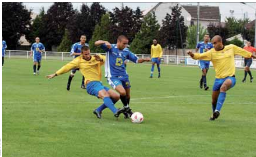
Dimanche 24 août, l'équipe d'Aubervilliers a débuté son championnat par une victoire 2 à 0 contre Poissy au stade Charles Sage à Drancy.

Mais il ne veut surtout pas s'emballer (« la vérité vient du terrain, je ne fais pas de pronostics ») car il sait que la tâche qui l'attend est rude. Et