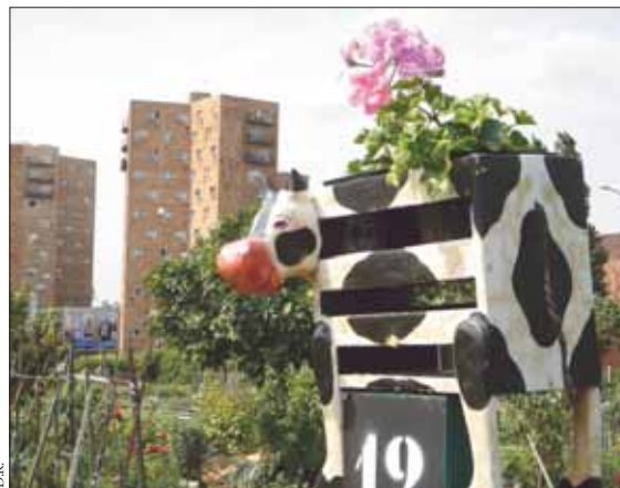
Patrimoine vivant, les jardins familiaux à voir au Fort d'Aubervilliers.

proximité, une balade en vélo sur l'agglomération organisée par Plaine Commune (renseignements sur www.plainecommune.fr ) et une foule de visites organisées par le Comité