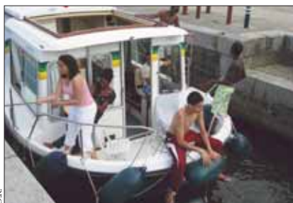
L'Omja a organisé une croisière sur la Loire. Au fil de l'eau, les jeunes ont pu y découvrir différents métiers.