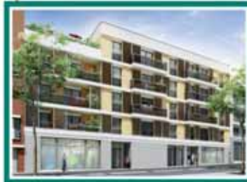
VUES SUR LA RUE DU LANDY