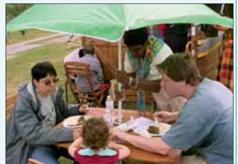
Repas préparés par les associations antillaises Colibri des Iles, Fregatethnik et Goûts et saveurs du monde.