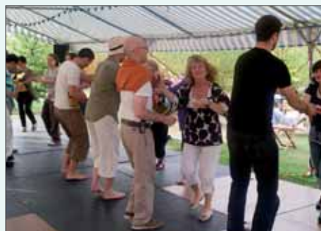
Initiation et séance de salsa, chaque mercredi soir, avec Indans'Cité.