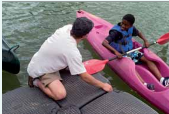
Initiation kayak avec le CMA, le jour de l'inauguration.