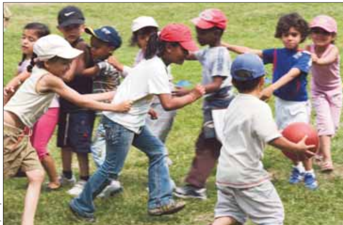
Tout l'été, les enfants des centres de loisirs maternels ont profité de l'espace et des installations du centre aéré municipal de Piscop.