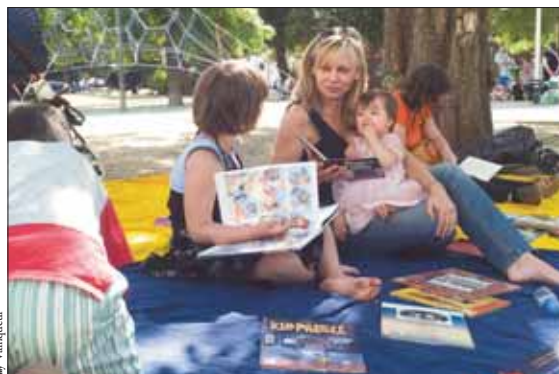
Du 10 juillet au 28 août. Les bibliothécaires ont fait la lecture aux enfants dans les espaces verts, ici square Stalingrad, dans le cadre de l'opération Bibliothèques de rue mise en œuvre par Plaine Commune.