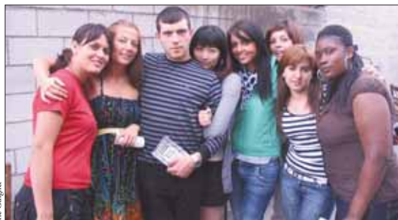
Du 1 er au 30 août. 17 volontaires de 10 nationalités différentes ont participé à un chantier international : donner un coup de jeune à l'ancien théâtre de la rue des Noyers.