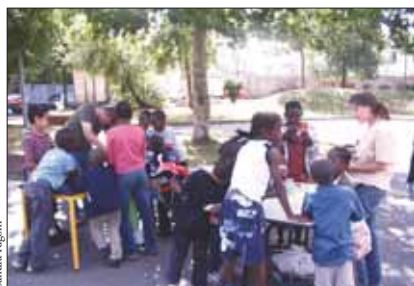
Mardi 12 août. Les enfants du Landy ont bénéficié d'activités ludiques et scientifiques proposées par l'association Les petits débrouillards.