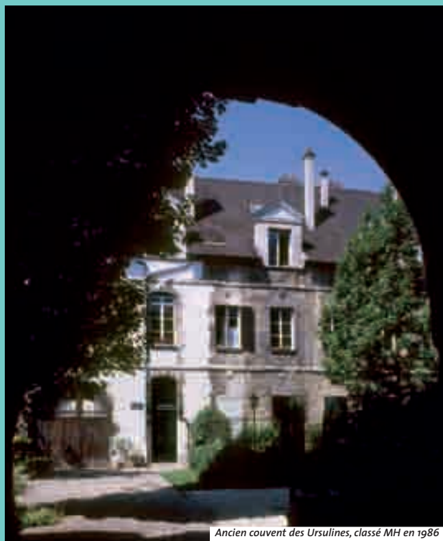
Ancien couvent des Ursulines, classé MH en 1986

Il faut continuer et dépasser ce qui pourrait nous apparaître comme le début d'un sandwich. Ici aussi, sous l'enseigne du nom révolutionnaire de Saint-Denis ■■■■■■■■■■, s'il me donne rendez-vous, c'est pour faire inscrire le témoin de mon passage (si ce n'est pas déjà fait). C'est la figure de la basilique qui doit désormais devenir notre phare. Elle est là, au bout de la rue.