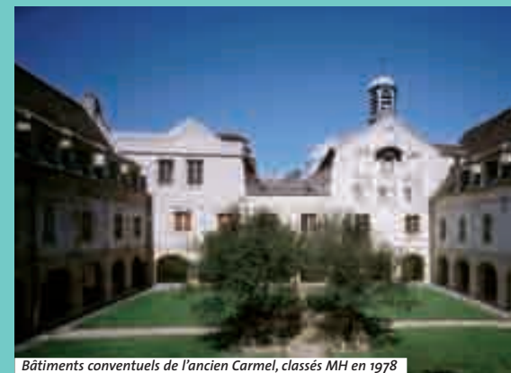
Bâtiments conventuels de l'ancien Carmel, classés MH en 1978