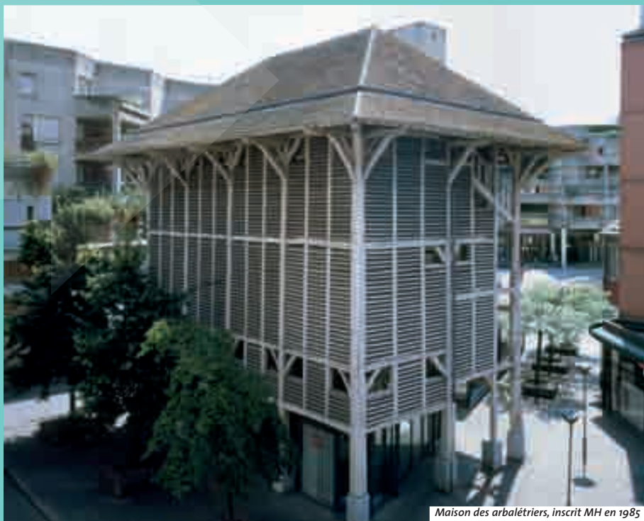
Maison des arbalétriers, inscrit MH en 1985

Un officier, un architecte : ce carrefour rassemble une partie de l'élite de la République. Tournant le dos à la basilique, j'avance. Il aime à prendre des nouvelles du temps en haut du mât noir et brillant. Se rapprochant d'un autre clocher, le messager bleu sur fond d'or ou gris annonce ses missions dans la pierre. Sous verre, plus loin, il nous indique qu'il y en avait six à Paris. Dans un ovale blanc. Ensuite, le cinéma. Il n'est plus ce qu'il était. Est-ce qu'il se souvient de « Charme et l'Insolence » avec cet acteur italien ? Sous nos pas, au croisement de quatre rues,