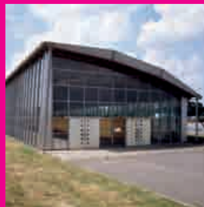
A // Le pavillon de l'aluminium