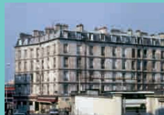
Immeuble d'habitation de l'usine Coignet, inscrit MH en 1998

██████████. Il faut poursuivre et rejoindre à nouveau le boulevard entraînant et le traverser prudemment sous le regard d'un œil-de-bœuf. C'est dans cette rue qu'il me parle de l'Italie, de l'architecture de la Renaissance et de ces visages féminins qui ne cessent de s'observer. Trois chats, deux lapins, trois oiseaux, il va à la rencontre du porte-drapeau ██████████. Revoilà le vaisseau extraterrestre à l'horizon. Mon guide m'en écarte, me fait traverser la voie et rejoindre un temple : colonnade, fronton ██████████ ██████████. Pierre ici, brique en face, au centre d'██████████.