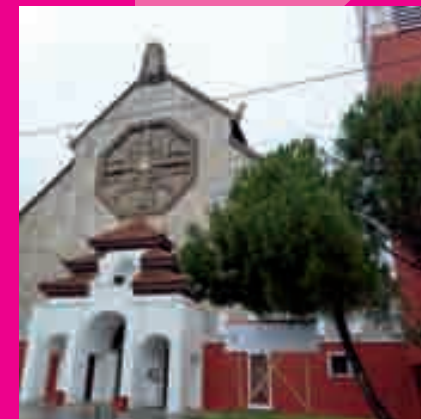
C // L'église Notre-Dame des Missions