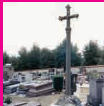
B // La croix de cimetière