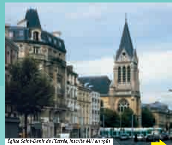
Église Saint-Denis de l'Estrée, inscrite MH en 1981

Au croisement, face à la brique, c'est la direction d'un lointain bosquet d'arbres qu'il m'indique. Le charme se rompt sur le boulevard bruyant. Pour continuer, il va vers une ancienne gendarmerie imposante même si elle ne porte plus son nom. Plus loin, soir de carnaval à Rio, la danse nous mène. Sur le trottoir opposé, face au collège, en levant le nez, c'est une pension quatre étoiles qui vend ses pensionnaires.