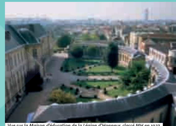
Vue sur la Maison d'éducation de la Légion d'Honneur, classé MH en 1927