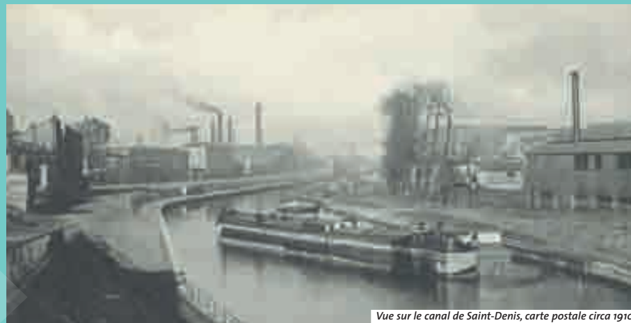
Vue sur le canal de Saint-Denis, carte postale circa 1910

la direction d'un port de mer au couchant le guide et lui donne la piste à suivre.