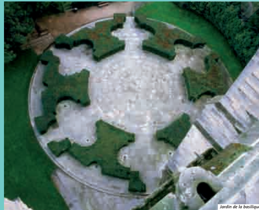
Jardin de la basilique

À partir des années 1970, le centre-ville, devenu vétuste et insalubre, va subir de fortes modifications : prolongation de la ligne 13 du métro, campagne de fouilles archéologiques, construction d'un nouveau quartier. Des architectes de renom vont