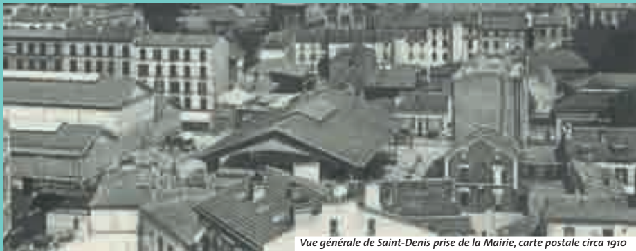
Vue générale de Saint-Denis prise de la Mairie, carte postale circa 1910

L'Unité d'archéologie de la Ville de Saint-Denis invite le public à découvrir la fouille programmée de l'îlot cygne au pied d'une maison construite du XV e au XX e siècle. À l'automne la « Fabrique de la ville » y sera présentée sous l'angle de l'archéologie, de l'architecture et de l'urbanisme.