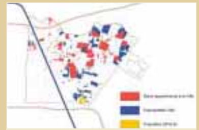
PATRIMOINE FONCIER PUBLIC (ETAT ACTUEL)