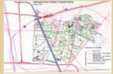
RESEAU ROUTIER (PROJECTION POUR 2010)