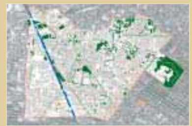
DOMAINE VEGETAL (ETAT ACTUEL)