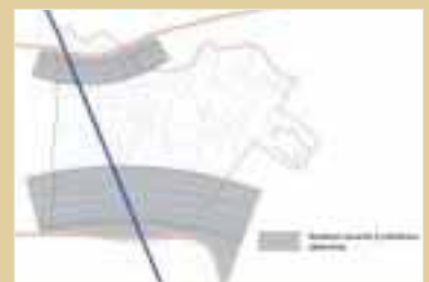
QUALITE DE L'AIR (ETAT ACTUEL)