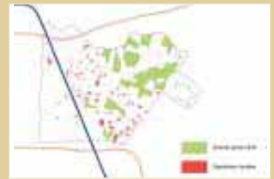
PATRIMOINE LOGEMENT SOCIAL (ETAT ACTUEL)